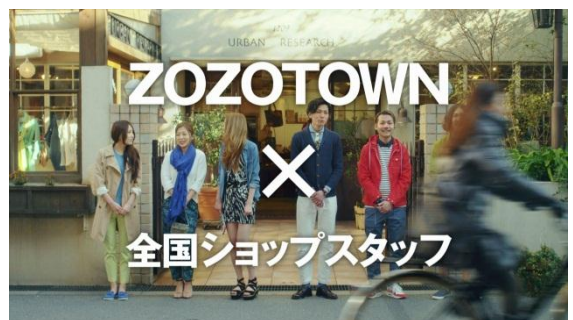
テレビ CM イメージ