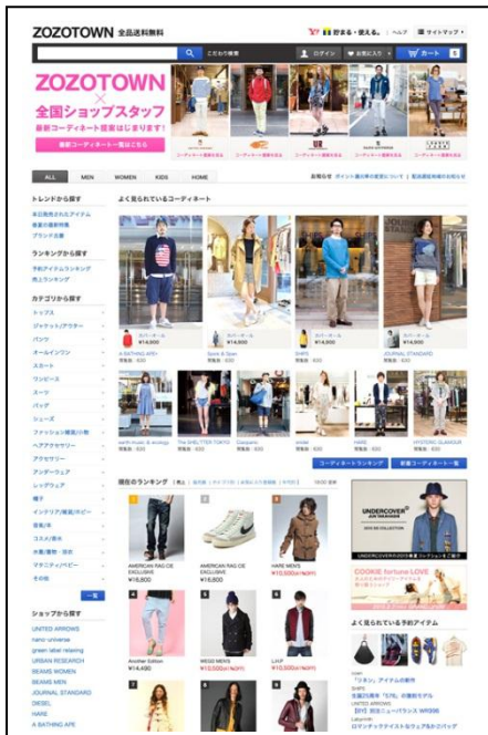
ZOZOTOWNトップページ イメージ