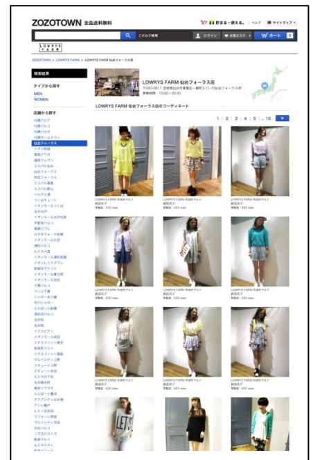
コーディネート一覧ページ イメージ