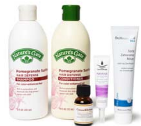
オープン記念キット

ZOZOTOWN では、コスメや雑貨など様々な商品を取り揃えています。中心価格帯は約 4,000 円、オープン時には約 300 型の型数で展開。また、ショップオープンを記念して、Cosme Kitchen の人気商品を集めた限定キットを販売いたします。