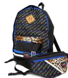
ZOZOTOWN 限定 デイバックとウエストバッグ

ZOZOTOWN では、メンズ・レディース共にウェアやアクセサリー、シューズなど様々な商品を取り揃えています。中心価格帯は約 10,000 円、オープン時には約 200 型の型数で展開。また、ショップオープンを記念して、デイバックとウエストバッグを限定販売いたします。