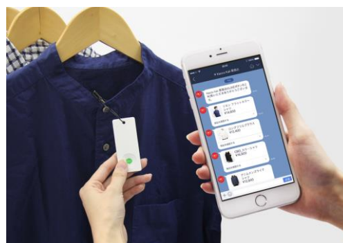
「ボタン型ビーコン」の使用イメージ

「ビーコン活用サービス」により、アパレル店舗に来店したユーザーが商品に取り付けられたボタン型ビーコンを押すと、LINE アカウントを経由して、その商品やお店の情報が直接ユーザーのスマートフォンに届きます。これにより、ユーザーは興味のある商品情報を手軽に受け取ることが可能となります。リアル店舗やお客様の日常生活において、適切なタイミングでの情報提供を目指し、オムニチャネルにおける販売促進の一環としてご活用いただけるよう、両社にてサービスプランの検討を重ねてまいります。※詳細に関しては、改めて発表させていただきます。