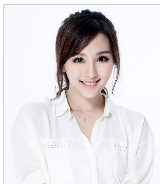
写真左: angelababy (アンジェラベイビー) 写真右: Dada Chan (ダダ・チャン)