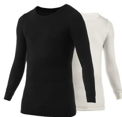
MEN : クルーネック