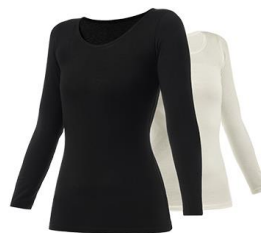
WOMEN : Uネック