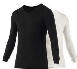
MEN : Vネック